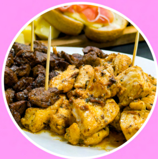
Tabla El Molino $20.000

Ideal 2 a 3 personas... (Salsa a elección) queso, salame, camarones salteados, carne de vacuno, pollo, aceitunas y tostaditas.